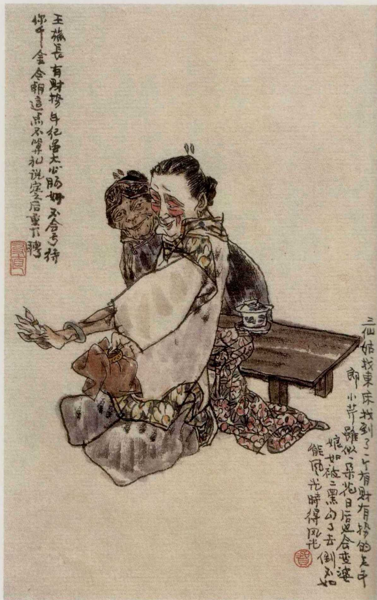
《小二黑结婚》贺友直